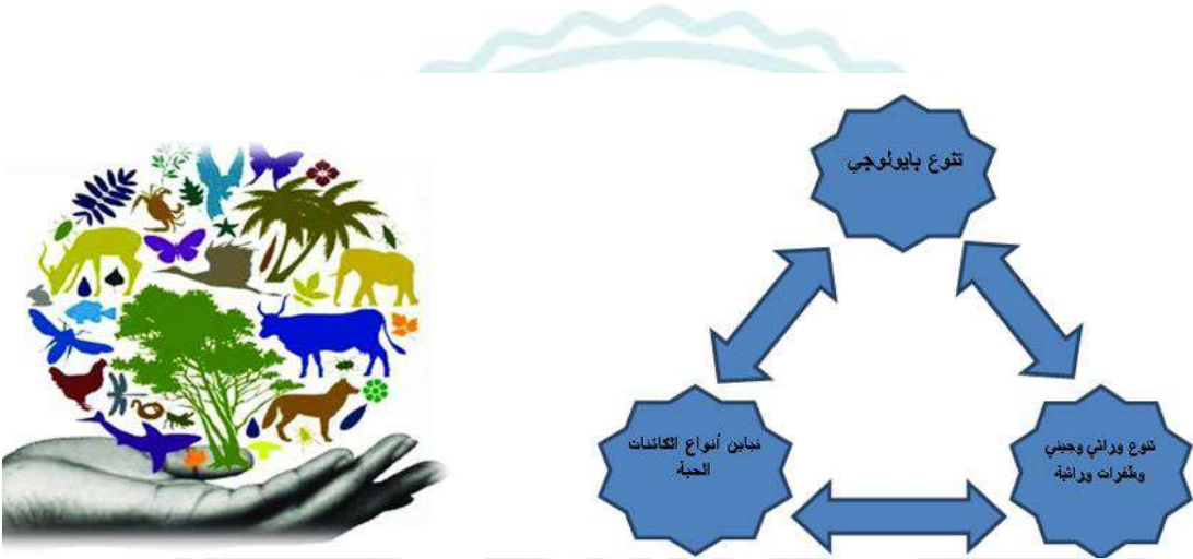
شكل رقم (1) مكونات التنوع البيولوجي

فالتنوع البيولوجي يضم تنوع وراثي وجيني وتباين مختلف انواع الكائنات الحية شكل (1)