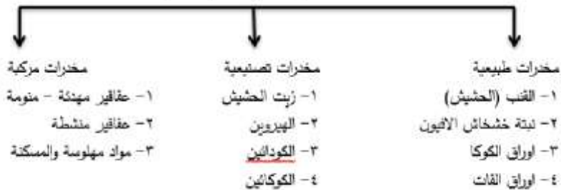
مخطط تقسيم المخدرات حسب مصدرها